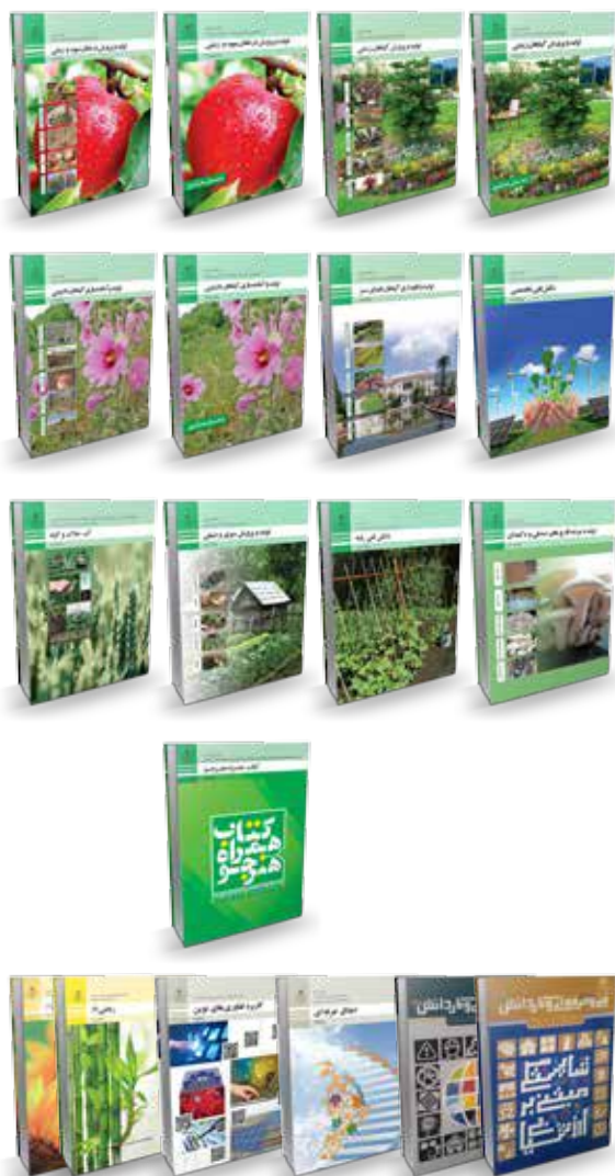
جدول شماره ۳ - اجزای بسته آموزشی رشته امور باغی